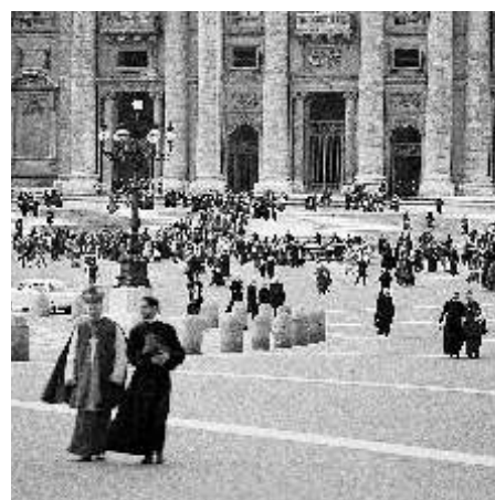
Padres conciliares saliendo de la Basílica de San Pedro