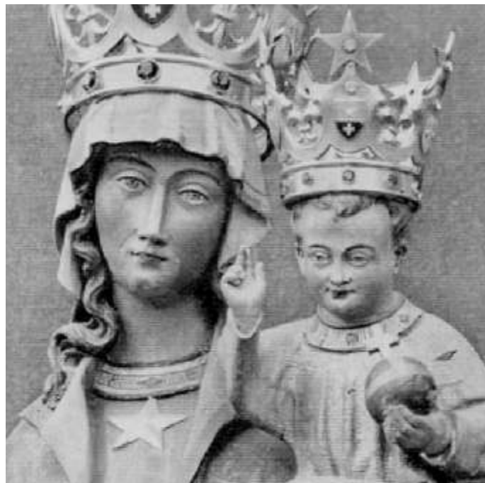
Nuestra Señora de la Estrella, Abadía de Montebourg

El 1° de mayo de 1960, en el noveno centenario de la fundación de la Abadía, se efectuó solemnemente la coronación pontificia de Nuestra Señora de la Estrella declarándola “Reina y Madre y Patrona Universal de las Escuelas Cristianas” concedida por Juan XXIII.